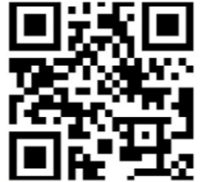
Канал в Telegram